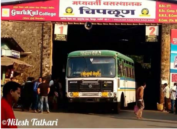
Chiplun Bus Stand

चिपळूण डेपो हा एक अजब प्रकार होता. हा चिपळूणचा जुना एसटी डेपो मुंबईहून आलेल्या गाडीला कोकणातले चालक वाहक व कोकणातून मुंबईच्या दिशेला जाणाऱ्या गाड्यांना मुंबईचे चालक वाहक. कधीकधी त्यांना शोधून आणावे लागेल असेही प्रकार मी ऐकले आहेत.