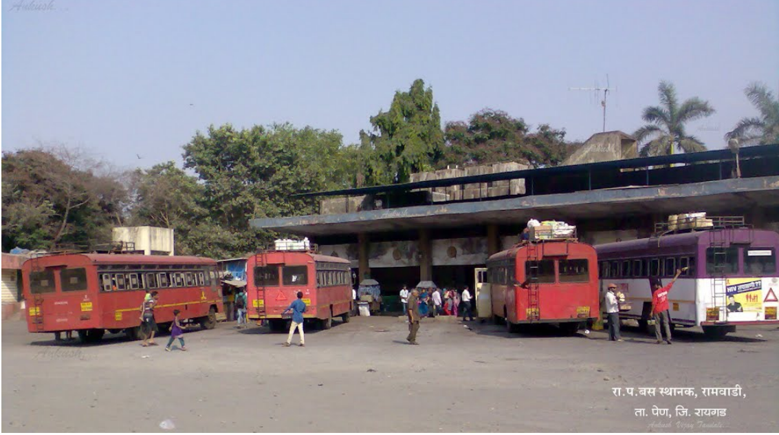
Pen Ramvadi Bus Stand

एक वेगळाच खेळ असे. मग त्यातून गाडी सुटायची वेळ झाली की कंडक्टर त्यांच्या विशिष्ट पध्दतीत घंटा मारत. टींग टींग टींग टींग. परत कितीही धमकावले, आरडाओरडा केला तरी कुठला पॅसेंजर मागे राहिला हे कधीतरीच घडे. त्यात मग कोणी उशीरा आला तर कंडक्टर बरोबर बाचाबाची, मग इतरांची मध्यस्थी हे सर्व फार गमतीदार वाटायचं. पण एसटी मार्गी लागली की लोकही आपापल्या जागी स्थिर होत व शांतता येई.