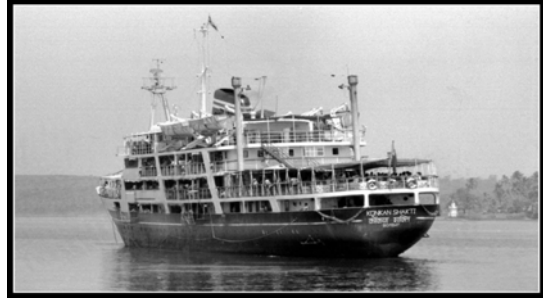
Vessel name Ramdas (Others Hiravati, Chandravati, Tukaram) Konkan Shakti