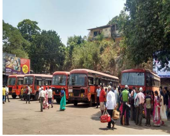
Sangameshwar Bus Stand