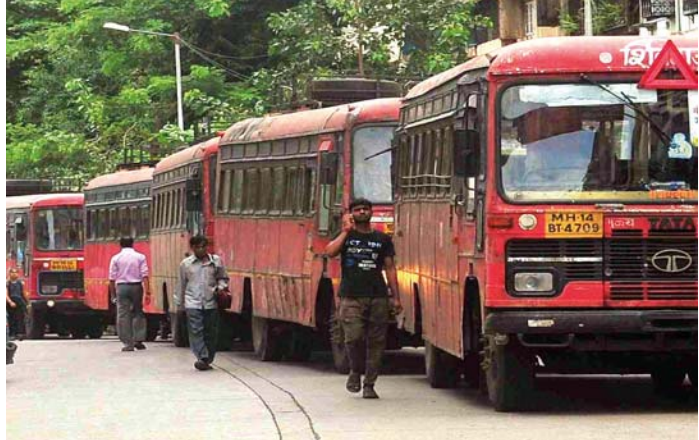
जादा गाड्या: गणपती