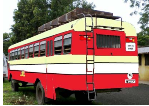
ST buses – Older design before Parivartan

मला तर कधी एकदा गोवा हायवे चालू होतो नि कंडक्टर ते बसमधले दिवे मालवतो, याची आतुरता असे.